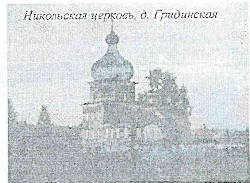
Никольская церковь, д. Гридинская

Хочется от всего сердца поблагодарить друзей из «Вер-